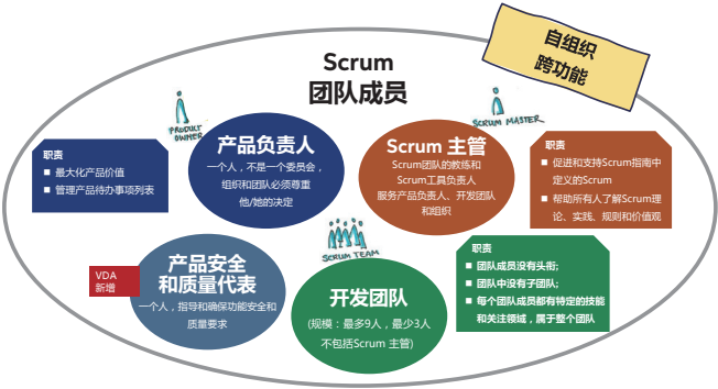
Scrum Team – VDA specifics / VDA 关于Scrum 团队的定义

产品安全在汽车行业非常重要。敏捷团队应该得到产品安全和符合性负责人的支持，以确保技术符合法律和顾客要求。这对于避免因为不满足技术符合性（产品安全）要求，无法实现增量（产品开发中发生的 Scrum 冲刺）所导致的挫败很重要。